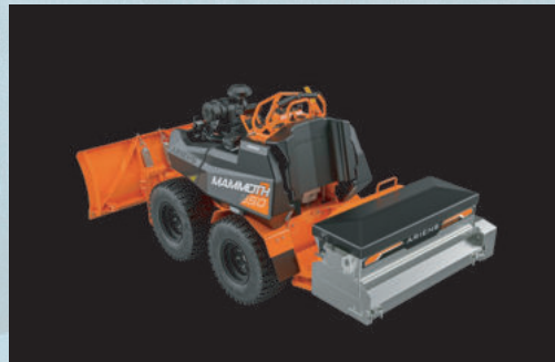
DISPENSADOR DE SAL 851006

Las hojas raspadoras de acero y las zapatas antideslizantes son estándar.