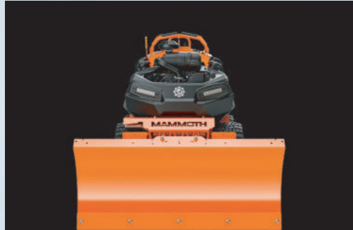
PALA DE NIEVE 48" 851003

Esta gruesa pala gira 30 grados hacia la izquierda y hacia la derecha y se ajusta fácilmente con el joystick eléctrico.