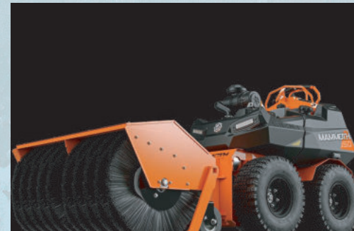
CEPILLO DE 44" 851004

Esta unidad montada en la parte trasera de acero inoxidable cuenta con 0,056 m 3 de capacidad, un ancho de caída ajustable de 30, 33 y 36 pulgadas (76, 83, 92cm) y un controlador de velocidad variable digital en el tablero.