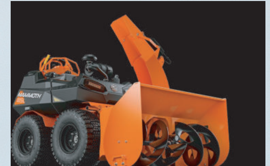
SISTEMA DE CUCHILLAS 36" 851002

El kit incluye todas las mangueras, bombas y boquillas, así como una varilla rociadora que se conecta al tanque.